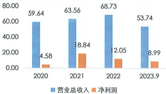
盈利状况 (单位: 亿元)