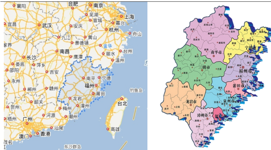
图表 3 福建省区位图