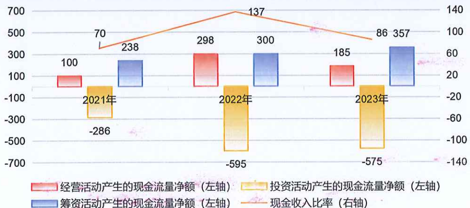
图表 10：公司各项活动现金流表现情况（单位：亿元、%）

2021年以来，公司投资活动现金流规模很大，形成了较大的现金支出压力。为满足资本支出需求，公司筹资活动现金流同步显著增长，主要来自股东增资及新增债务融资。