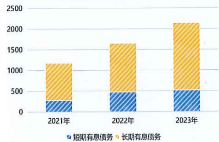
公司全部债务结构 (单位: 亿元)