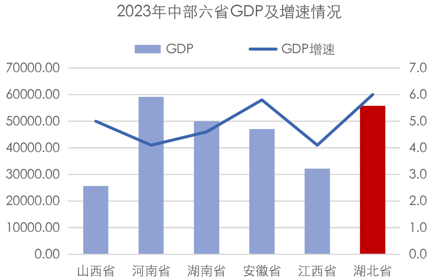
图表3 湖北省主要经济指标及对比情况（单位：亿元、%）

近年来，湖北省经济总量逐年增长，经济增速有所波动。2021年~2023年，湖北省分别实现地区生产总值50012.94亿元、53734.92亿元和55803.63亿元，同比分别增长12.9%、4.3%和6.0%。2023年，湖北省经济总量在全国31个省级行政区中排名第7位，在中部地区6个省级行政区中排名第2位。分产业看，2023年，湖北省第一产业增加值5073.38亿元，同比增长4.1%；第二产业增加值20215.50亿元，同比增长4.9%；第三产业增加值30514.74亿元，同比增长7.0%。