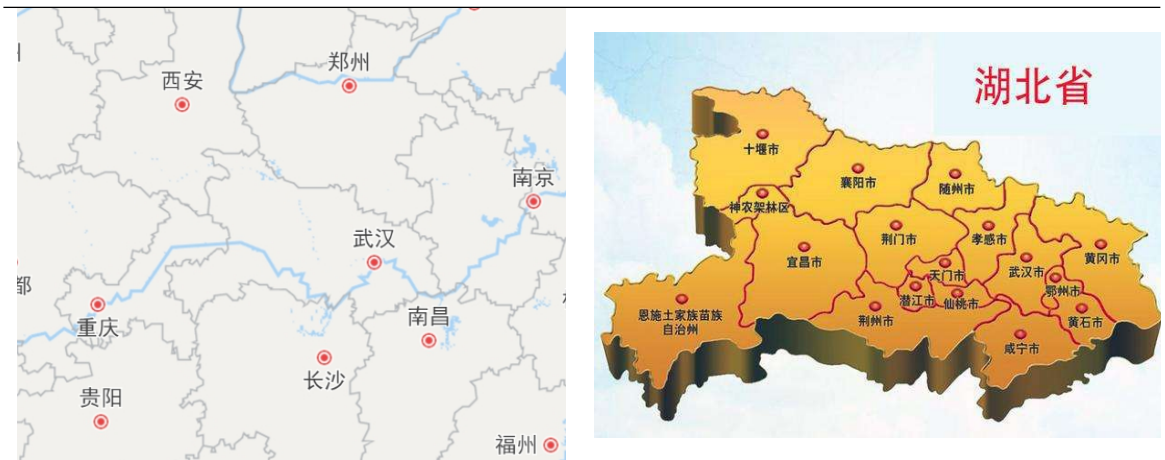
图表 2 湖北省区位图

交通区位方面，湖北省形成了以武汉为中心的放射形水陆空立体交通格局，交通区位优势明显。公路方面，京港澳、大广、二广、福银、沪蓉、沪渝、杭瑞等多条国家高速公路及8条国道在湖北省境内交织；截至2022年末湖北省公路总里程达304131公里；高速公路里程达7598公里。铁路方面，湖北省境内的铁路线有京广线、京九线、武九铁路、襄渝线、汉丹线、焦柳线、长荆线、宜万铁路及渝利铁路等；湖北省高铁网形成了以武汉站、武昌站、汉口站为中心的放射状格局，主要高铁线路有京广高铁、沪蓉高铁、汉十高铁、武九客运专线、武冈城际铁路、武孝城际铁路、武咸城际铁路及仙桃城际铁路等，截至2022年末，湖北省高铁里程达2056公里，居全国第9位。水路方面，由长江、汉江以及各大支流构成的水路网在湖北省立体交通格局中发挥着重要作用。航空方面，武汉天河国际机场是华中地区规模最大、功能最齐全的现代化航空港，是全国十大机场之一；此外，湖北省已启用的民航机场还包括宜昌三峡国际机场、襄阳刘集机场、恩施许家坪机场、神农架红坪机场、十堰武当山机场及荆州沙市机场等。