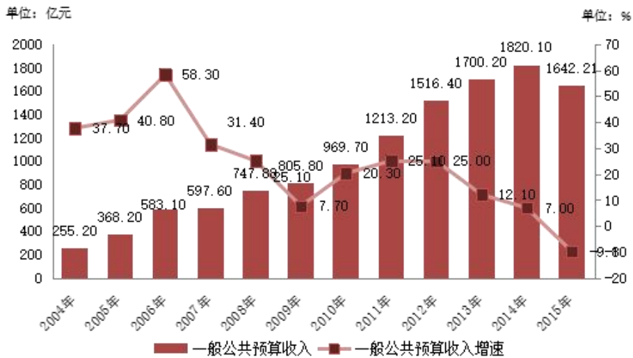
图3：2004年~2015年山西省一般公共预算收入和增速情况

2015年，山西省财政收入一般公共预算收入在全国31个省级行政区中排名第22位，同比下降2位。